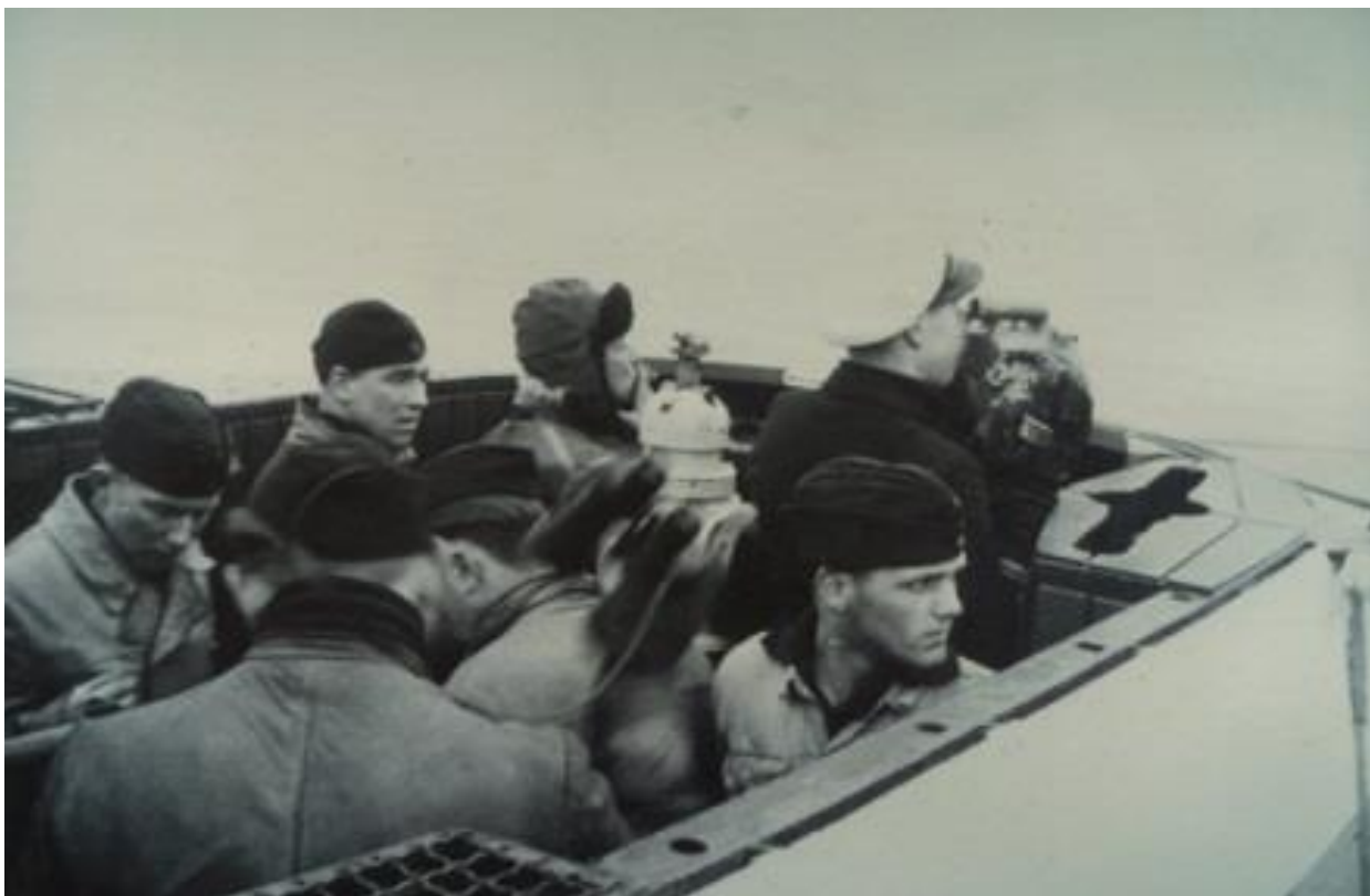
U-717 в походе

3 сентября U-717 навсегда покинула финские берега и вышла в новый боевой поход. 11 сентября лодку атаковал неизвестный самолёт. Больше значимых событий за время похода не произошло. Боевой поход завершился 25 сентября в эстонской Виндаве (ныне это эстонский город Вентспилс), которая вместе с Либавой стала новой базой немецких подлодок.