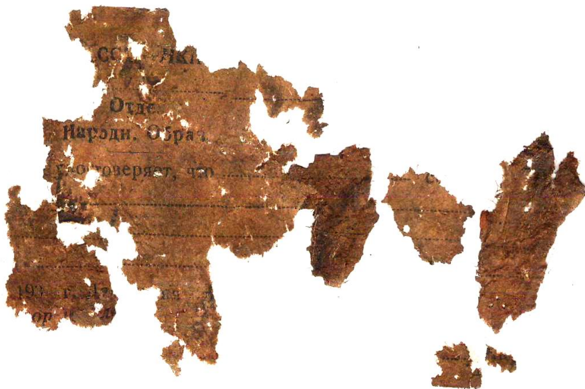
Фото 21. Бланк удостоверения Отдела Народного Образования (после обработки).