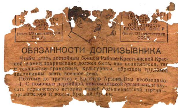
Фото 19-20. Памятка Уфимского Райвоенкомата призывникам (после обработки).

В данной памятке обращает на себя внимание то, она была выпущена Уфимским районным военным комиссариатом в «соавторстве» с Военным отделом Уфимского райкома ВКП(б), т.е. местом её вручения могла быть г.Уфа или район города Уфы. Сокращения, используемые в тексте памятки: ВС – комплекс «Ворошиловский Стрелок», ПВХО – комплекс «Готов к противохимической обороне», ГТО – комплекс «Готов к труду и обороне», ГСО – комплекс «Готов к санитарной обороне».