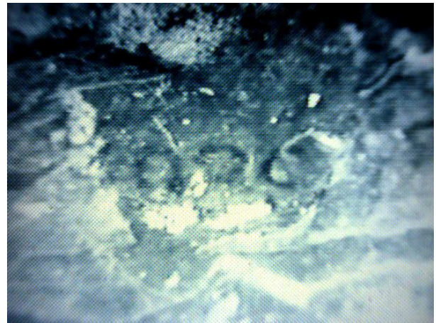
Фото 11 и 12. Фрагменты типографских надписей «ДЕЙСТВИТЕЛЬНО» и «1939».

Заключительный фрагмент № 7, является, несомненно, нижней кромкой последней (приклеенной на обложку) внутренней страницы удостоверения, с указанными в строке типографическими данными (характерно для удостоверений и билетов любого типа). Документов с аналогичными типографическими данными (в данном фрагменте данных, по-видимому, указан размер при резке печатного листа формата А8), ни среди удостоверений, ни среди другого вида довоенных документов с обложками на сегодняшний день обнаружено не было.