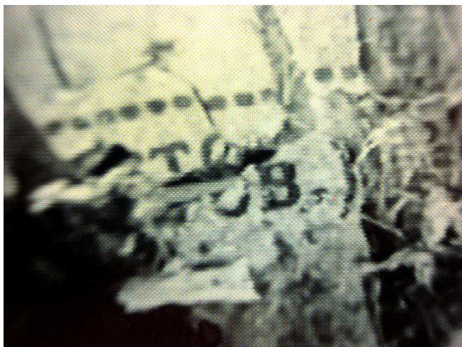
Фото 8. Общее изображение фрагмента текста № 2.