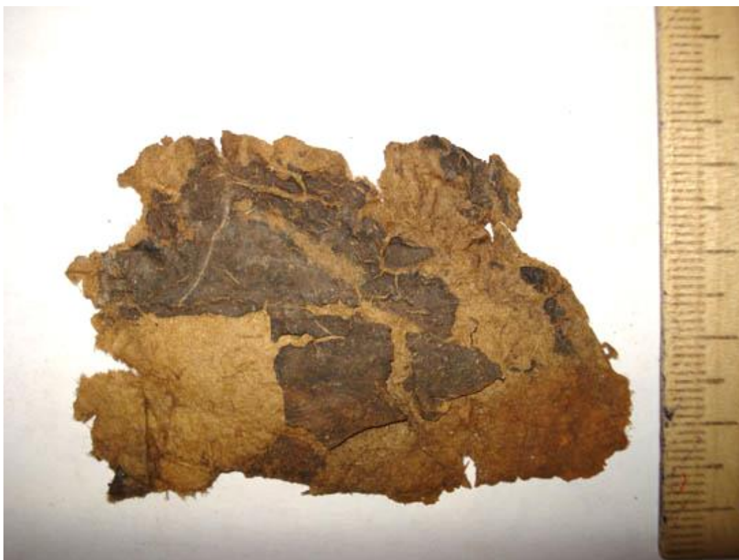
Фото 6. Общий вид внутренней стороны сохранившегося фрагмента обложки удостоверения (после обработки) с наклеенным лицевым листом (черные фрагменты на картоне).