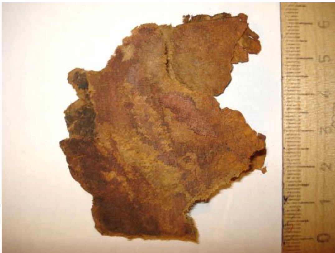
Фото 5. Общий вид сохранившейся части обложки удостоверения (после обработки).

Данный документ представляет собой обложку из толстого картона, общими размерами 57 мм x не менее 55 мм. Обложка имела матерчатое покрытие на тканевой основе красного цвета, фрагментарно сохранившееся. Был вывернут внутренней частью наружу, что повлекло за собой почти полное уничтожение бумажного вкладыша (книжечки), от внутренних бумажных листов сохранились отдельные мелкие фрагменты.