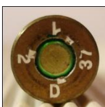
P490 Hugo Schneider A.G., Werk Altenburg