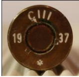
P151 Rheinisch-Westf.-Sprengstoff A.G., Werk Nürnberg und Stadeln