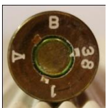
P345 Silva Metallwerke, Genthin (Polte)