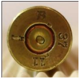
P Polte, Magdeburg.