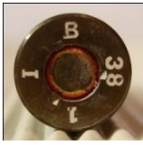
P Polte, Magdeburg.