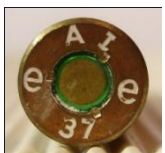
P413 DWM, Werk Lübeck-Schlutup