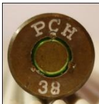
Kopp Treuenbitzen. (P25)