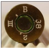
P186 Metallwerk Wolfenbüttel G.m.b.H., (Polte)