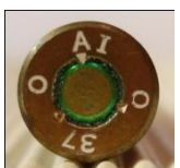
P413 DWM, Werk Lübeck-Schlutup