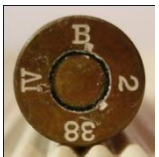
P154 Grüneberger Metallgesellschaft m.b.H., Grüneberg/Mecklbg (Polte)