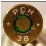
Kopp Treuenbitzen. (P25)