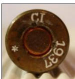
P120 Dynamit-A.G., vorm. Alfred Nobel & Co. (DAG), Werk Empelde