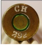
Kopp Treuenbitzen. (P25)