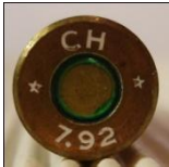
Kopp Treuenbitzen. (P25)