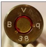
P345 Silva Metallwerke, Genthin (Polte)