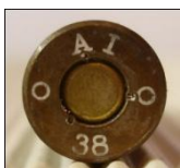
P413 DWM, Werk Lübeck-Schlutup