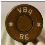
P345 Silva Metallwerke, Genthin (Polte)