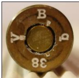
P345 Silva Metallwerke, Genthin (Polte)