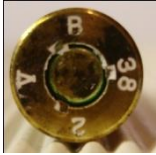
P345 Silva Metallwerke, Genthin (Polte)