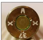
P131 Deutsche Waffen- u. Munitionsfabriken A.G., Werk Berlin-Borsigwalde