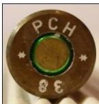
Kopp Treuenbitzen. (P25)