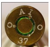
P413 DWM, Werk Lübeck-Schlutup