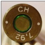
Kopp Treuenbitzen. (P25)