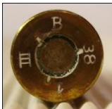
P186 Metallwerk Wolfenbüttel G.m.b.H., (Polte)