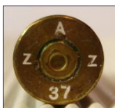
P131 Deutsche Waffen- u. Munitionsfabriken A.G., Werk Berlin-Borsigwalde