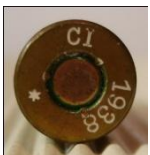
P120 Dynamit-A.G., vorm. Alfred Nobel & Co. (DAG), Werk Empelde