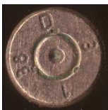
P490 Hugo Schneider A.G., Werk Altenburg