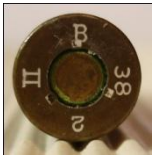
P207 Metallwerk Odertal G.m.b.H., Bad Lauterberg/Harz (Polte)