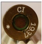
P120 Dynamit-A.G., vorm. Alfred Nobel & Co. (DAG), Werk Empelde