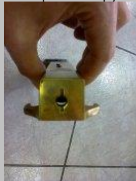
Станок - латунь Царский: