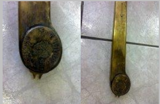
Вот крышка пружины, латунная: