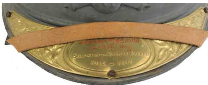
Отличительный знак великой войны с гравировкой.