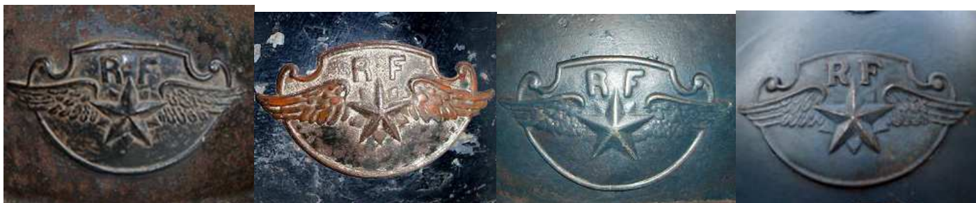
Эмблема Мле 23 военная авиация.

Военная авиация получила этот знак в 1923, официально в массовом порядке с 1924, Он заменил несколько неофициальных эмблем, используемых ранее.