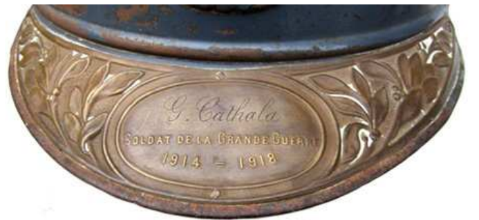
Отличительный знак великой войны с гравировкой (отличается шрифтом).

Указом 18 декабря 1918, французское правительство учредило отличительный знак на каску для каждого офицера и солдата находящегося в зоне действующей армии.