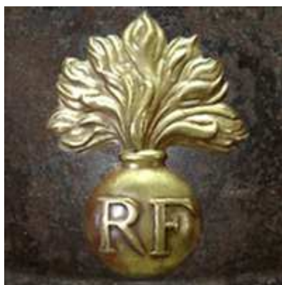
Мле 27, вариант.