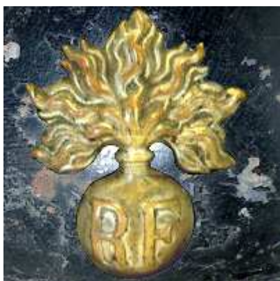
Мле 27, вариант.