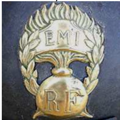
Военная школа инфантерии.