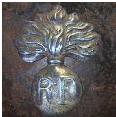
Мле 21, Гие департамент.