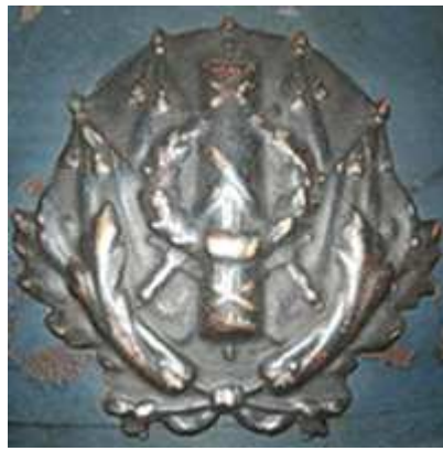
Знак на парадный головной убор (кепи), латунь.