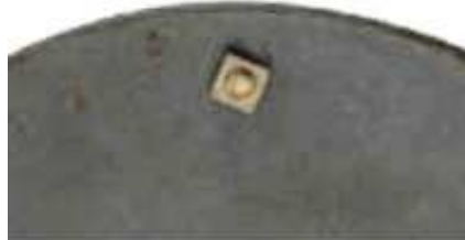
Крепление Парижских производителей.