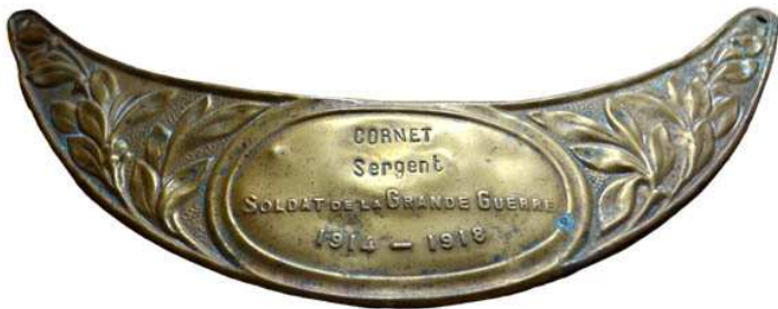
Отличительный знак великой войны с гравировкой.