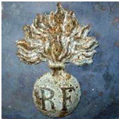
Мле 15, Прево.

Дополнение к описанию формы жандармерии от 30 ноября 1927 описывает эмблему Сил Республиканской Гвардии как гранату из латуни.