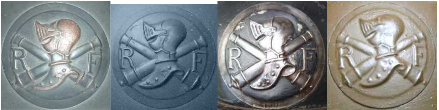
Эмблема Специальной Артиллерии, тип 1, названная «короткий выстрел».

Она отпечатана на щите 65 мм и доступна в двух версиях дифференцированных по форме шлема.