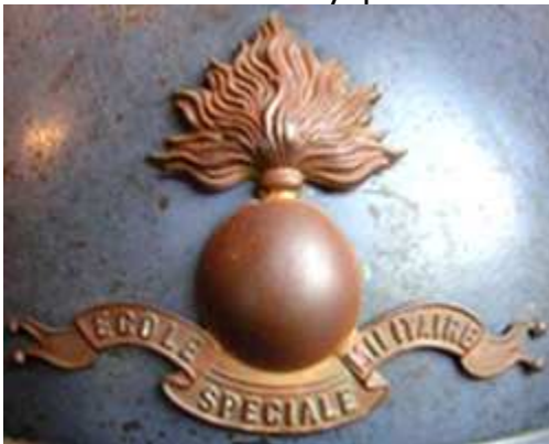
Специальная военная школа St Cyr.

Шлемы школ часто украшают эмблемы из латуни.