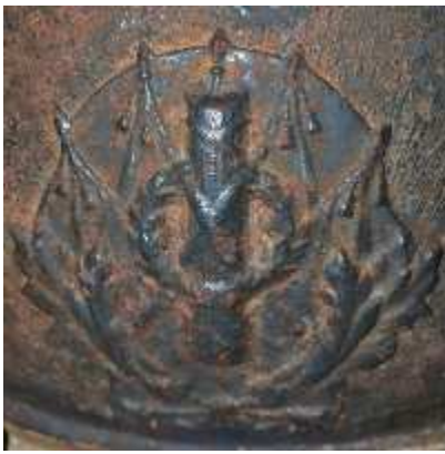
Пластина 70 мм.