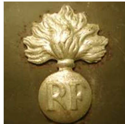
Мле 27, Силы Республиканской Гвардии