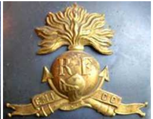
Военная школа инфантерии и Танков с 1925.