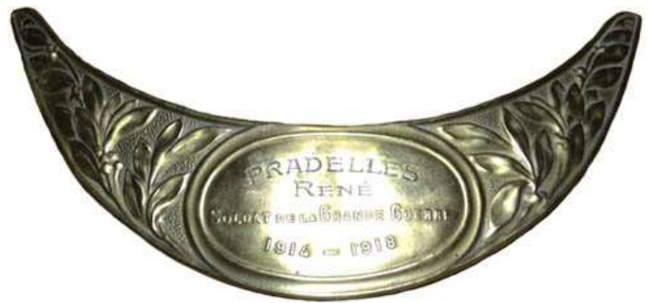
Отличительный знак великой войны с гравировкой.