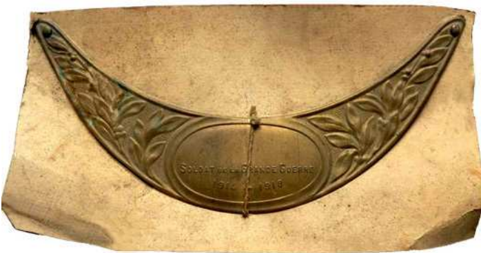
Почетный знак великой войны на упаковочной коробке.