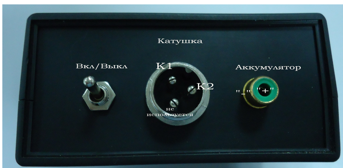
Рис. 2. Задняя панель