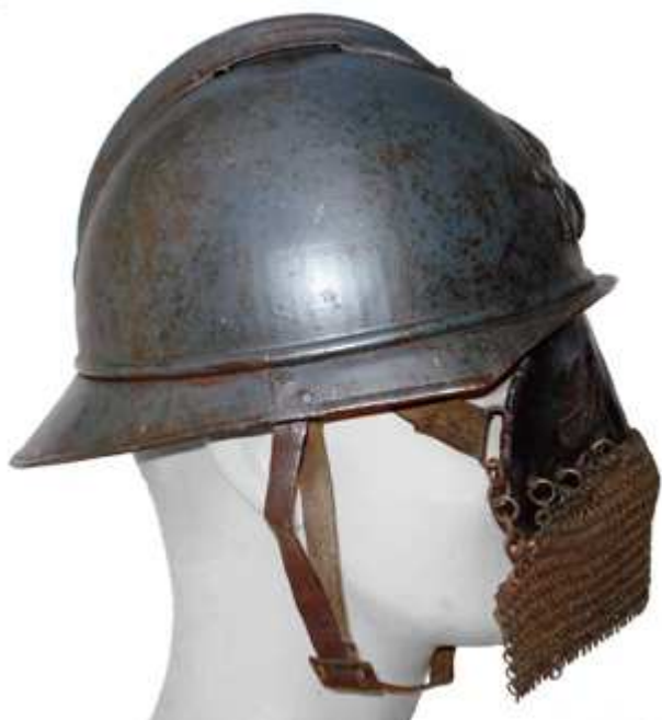
М1е15 модификации А.С.