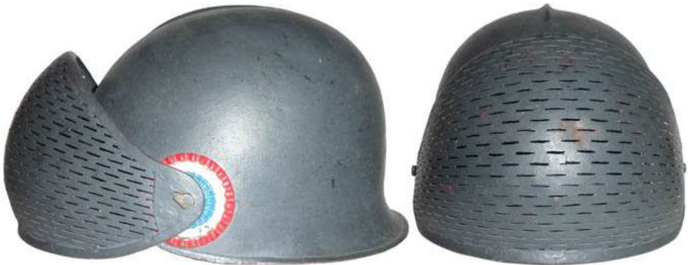
Забрало Dunand установленное на пробной модели шлема Dunand.