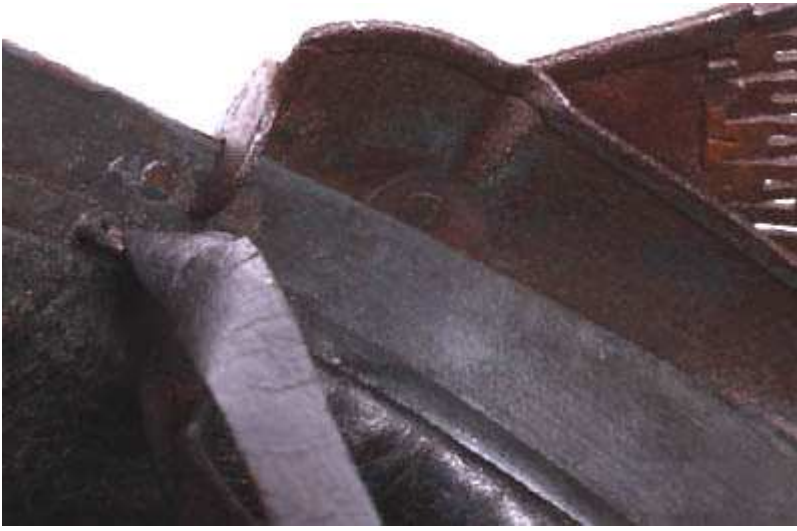
Детали боковой скобы.