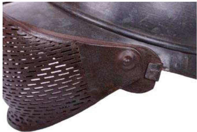
Детали оси вращения.