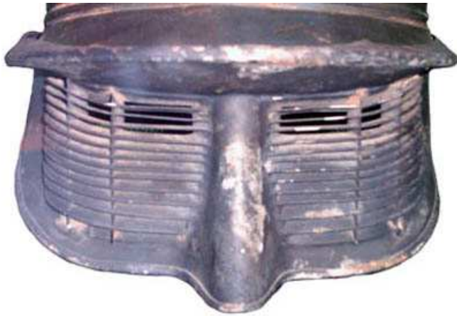
Забрало Polack 1й модели, установленное на козырёк Mle 15.