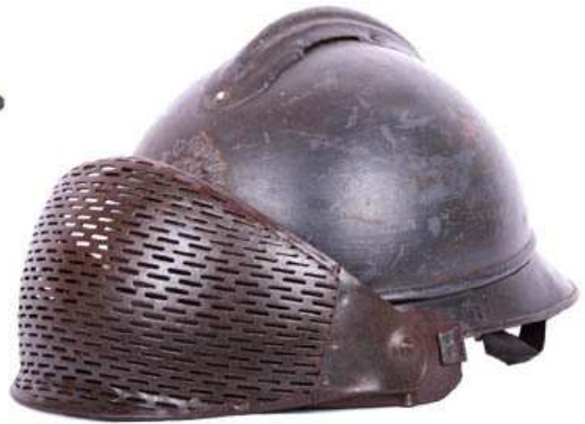
Забрало Dunand последней модели, в поднятом положении.