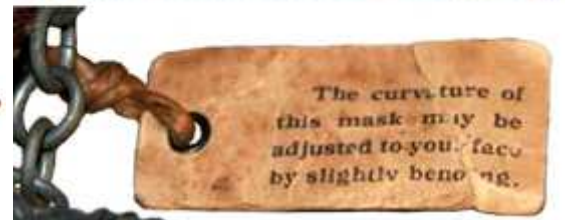
Британские инструкции на ярлыке.