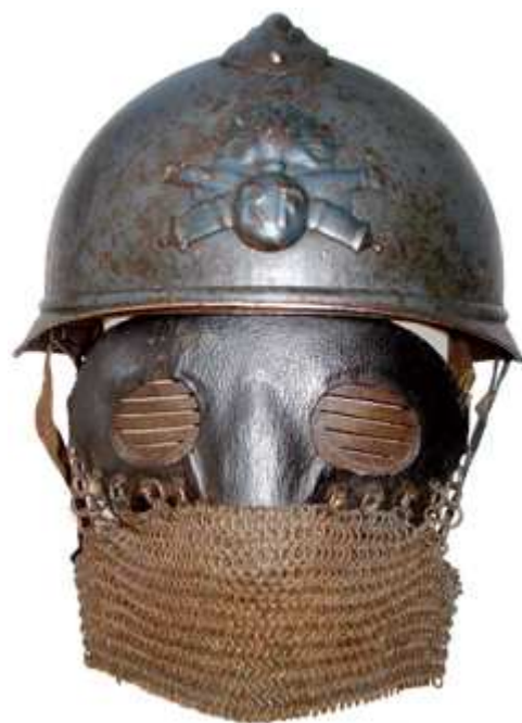
М1е15 модификации А.С.