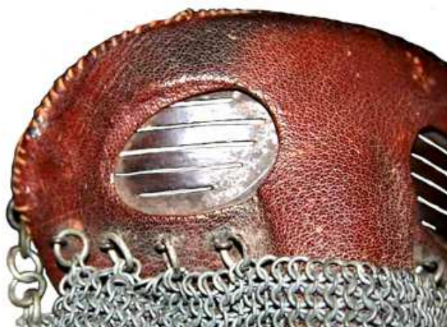
Прорези для обзора.