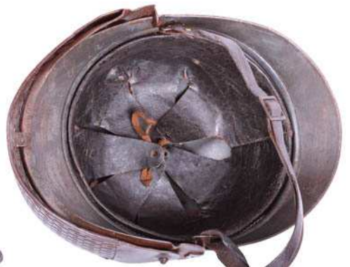
Изображения забрала Dunand последней модели, фото F. Coune.