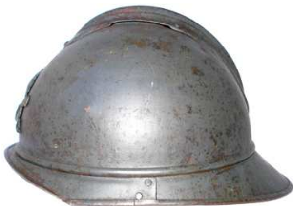
Mle15 модифицированный A.S.

Рекомендовали покрывать эту часть сукном шириной 1 см., что бы уменьшить воздействие при ударе. Некоторые крепили мягкую ткань, другие крепили полосу из кожи по концам фиксируя её заклёпками, третьи оставляли голый металл. Было также предложено удалить гребень и заменить его на металлическую пластину. Быстро от этой рекомендации отказались, так как пластина мешала вентиляции. Эти изменения выполняли кустарным способом, они имели массу вариантов исполнения.