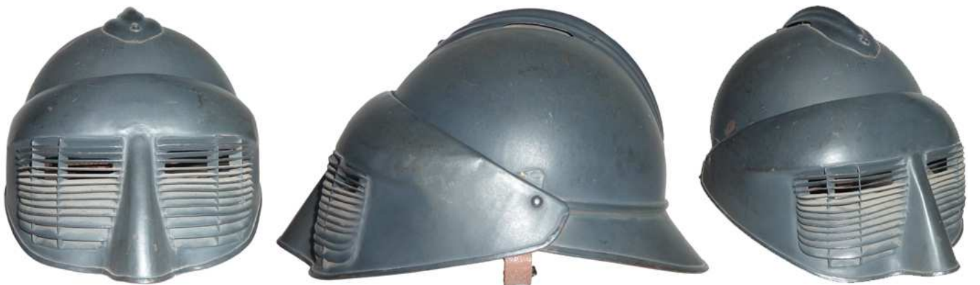
Забрало Polack 2й модели, установленное на Mle15.

Несколько тысяч экземпляров были опробованы, но эти устройства оказались громоздкими и не подходили для ведения боевых действий находясь в защитном положении.